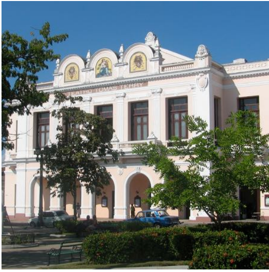
Teatro Tomás Terry, Cienfuegos