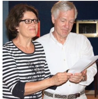
Deux étudiants font une présentation.