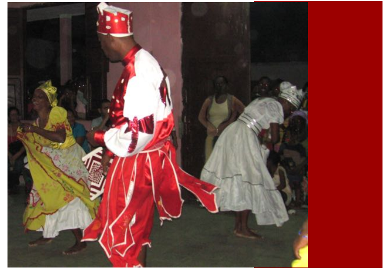
Visite à Palmira, Los Orishas