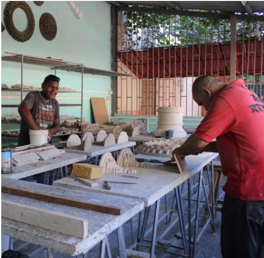
Visite de l'école des métiers Joseph Tantete Dubruiller