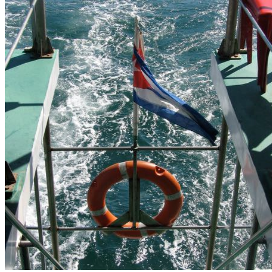
Promenade en bateau, baie de Cienfuegos