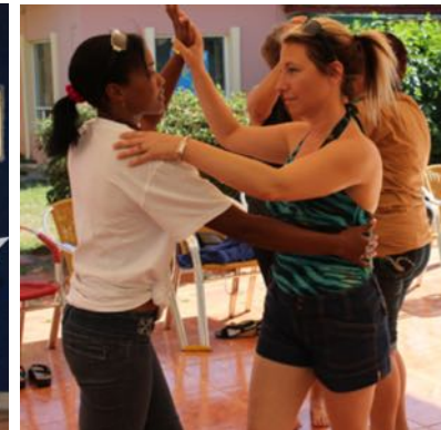
Quatre heures de cours de salsa en espagnol.